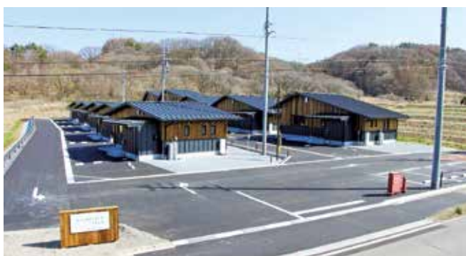
地元木材活用の立科町営住宅

町長 居宅サービスから施設への移行が顕著で負担が増している。人手不足もあるが各事業の収支バランスを整え対処する。