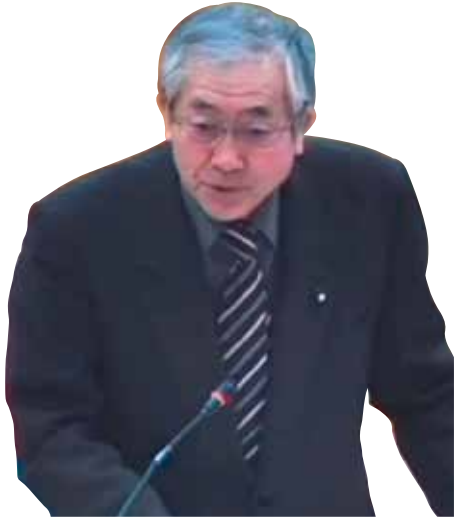
わたなべ ひとし 渡辺 均 議員