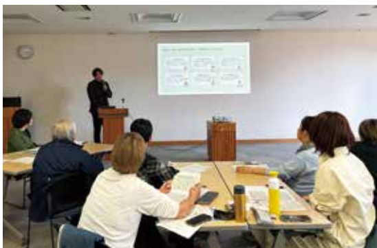
2月26日に開催した多文化共生研修の様子