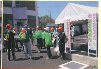
佐久市強歩大会等でのPR活動