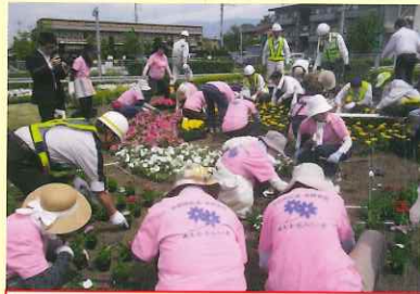
佐久IC花壇への花の植栽活動

女性みちの会は、中部横断自動車道の建設を促進するため、女性の視点から情報発信、要望活動、美化活動など様々な活動をしています。