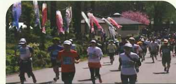
佐久鯉マラソン大会