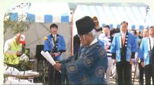
新生児出世健康祈願