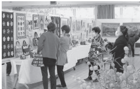
表現していました。

出演者を含め約一三〇名を超える皆さんが、ステージで発表される出演者に対して、大きな拍手で感動を