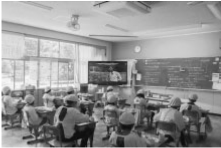
教室内で作業工程や生産者からのビデオメッセージを見る児童・生徒のみなさん

また、生産者の皆様にご協力いただき、事前収録した動画が流れ、児童・生徒のみなさんは、生産者の方々のお話や作業の様子などを見ながら美味しくいただきました。