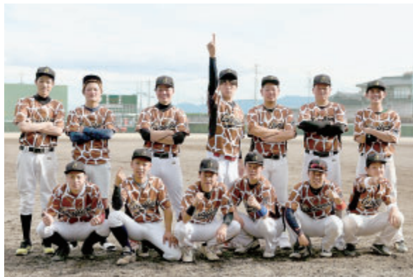
公民館登録グループの野球チーム「ジラフズ」が10月2日に飯田市営今宮球場で開催された、ZETT GRANDPRIX 2021 北信越大会で見事優勝し、1月末に神戸市で開催される全国大会の出場が決まりました。