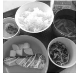
大日向小学校では自校の畑で育てたブルーが出ました。