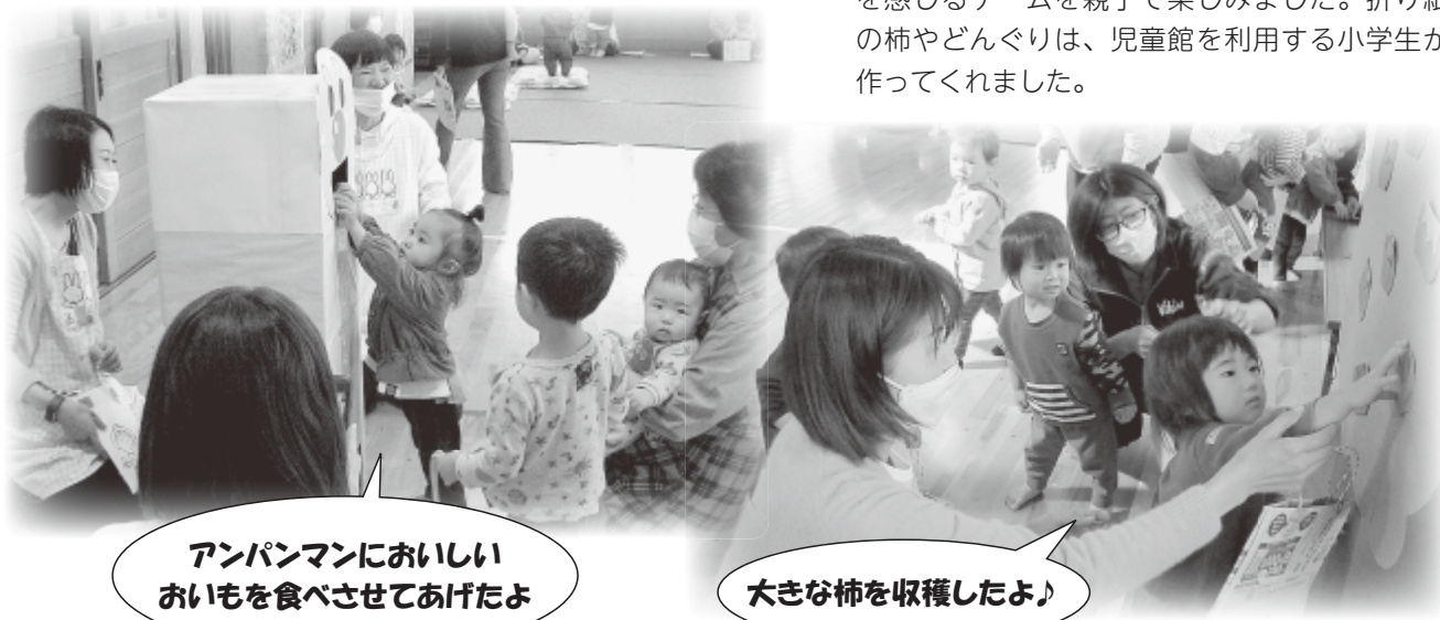
アンパンマンにうれしい おいもを食べさせてあげたよ

10月21日に小海なかよし児童館で乳幼児親子を対象に運動会ごっこを行いました。参加した親子は、折り紙の柿やどんぐりなどを集め、秋を感じるゲームを親子で楽しみました。折り紙の柿やどんぐりは、児童館を利用する小学生が作ってくれました。