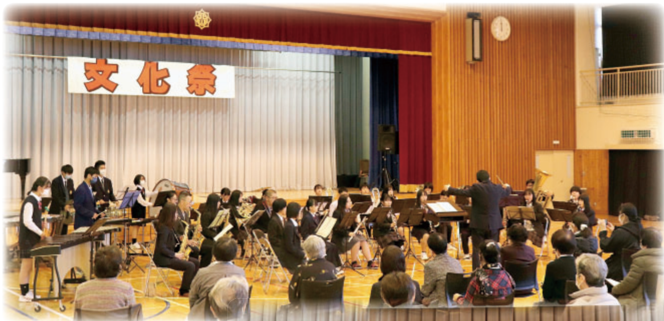
第49回文化祭ステージ発表 第37回合同音楽祭 11月3日：北牧体育館