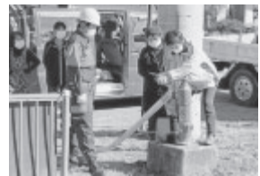
女性への消火栓操作指導

普段、近所の消火栓を目にするも、触ったことのない訓練参加者でしたが、消防署員から、「火災発生から消防自動車到着までの数分間が初期消火で一番大事」と説明され、参加者も消火栓の取り扱い方などをつうじて火災発生時の初期消火の重要性を改めて考える良い機会となりました。また、各地区にある非常サイレンの操作訓練も行われ、操作方法が分からなかったのが、覚えることができよかった。いざという時は、区民もサイレンの操作を共有しておくことが大事であると再確認できました。訓練終了後は、各地区公民館等で、本日の訓練の振り返りや、防災用品の不足品の点検と確認を行い、災害時の備えを確認する場となりました。