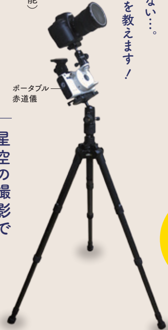
ポータブル 赤道儀