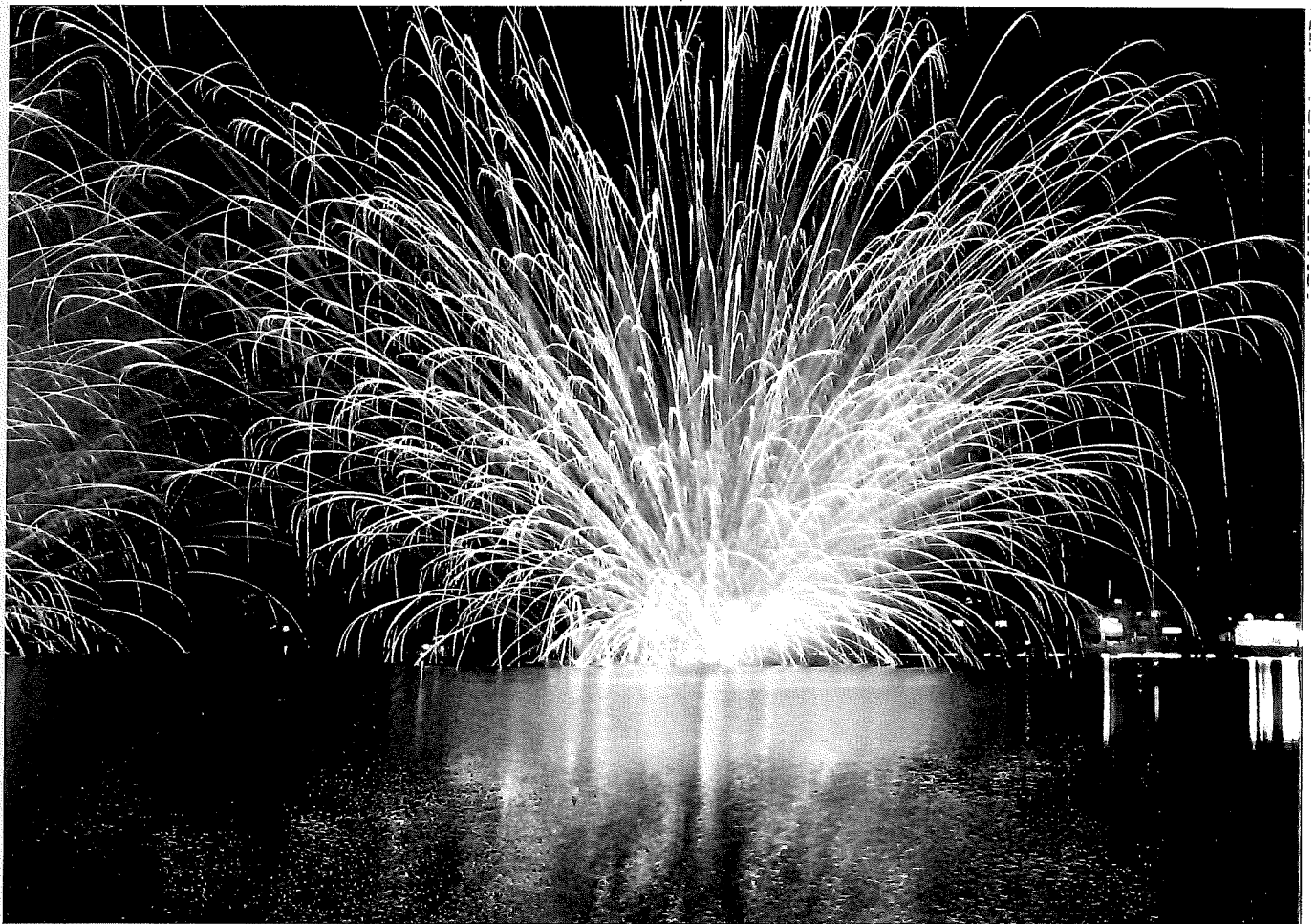
松原湖灯籠流し花火大会(小海町)

「長野県自転車の安全で快適な利用に関する条例」と 「長野県自転車活用推進計画」について