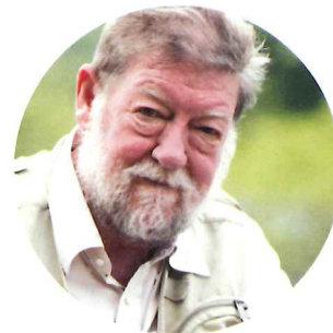
長野県森林大使 C.W. ニコル 氏