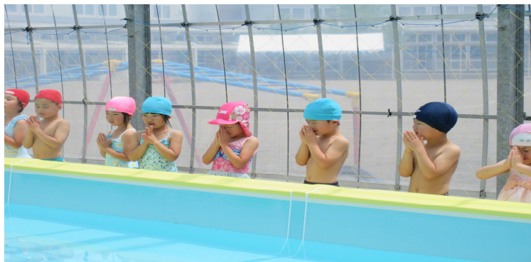
年長、年中のプール開き

暑い中でのプール遊びで、子ども達も疲れがたまってきます。十分な睡眠と栄養で体調を整えるようお願いいたします。