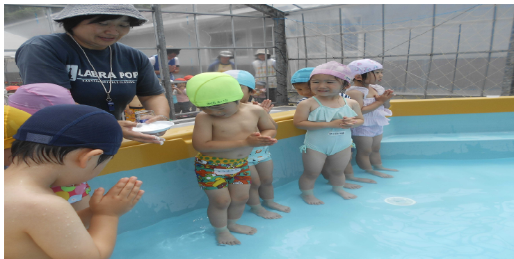
年少、未満のプール開き