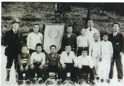
第1回佐久スケート連盟

この歴史のあるスケート小海に育った子供たちは、昭和40年頃県ジュニア大会で好成績を収め一躍注目された。その伝統を受け継ぎ、今シーズンも寒さと強風の中練習に励んでいる。