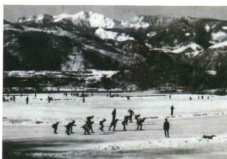
賑わいをみせる猪名湖（松原湖）