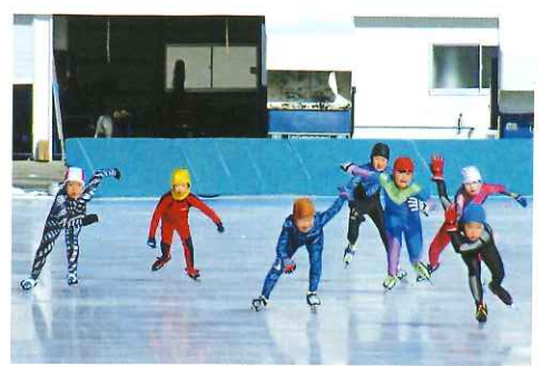
パイピングスケート場育ちの豆スケーター